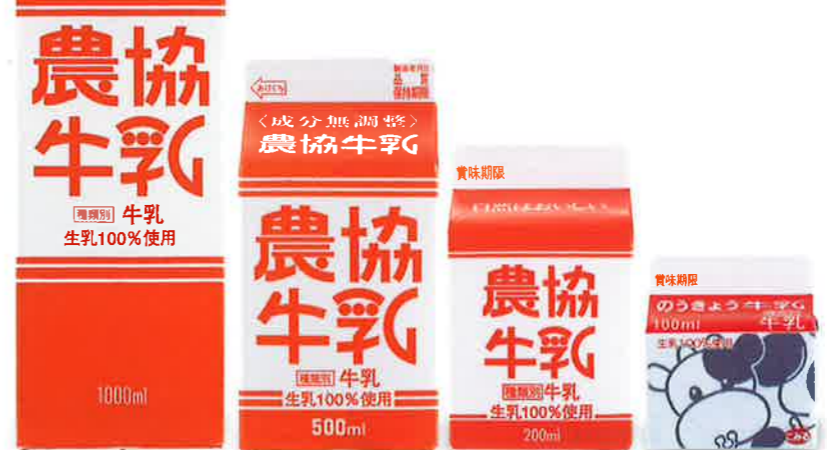
1000ml 500ml 200ml 100ml